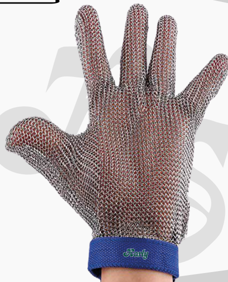
GUANTE DE METAL